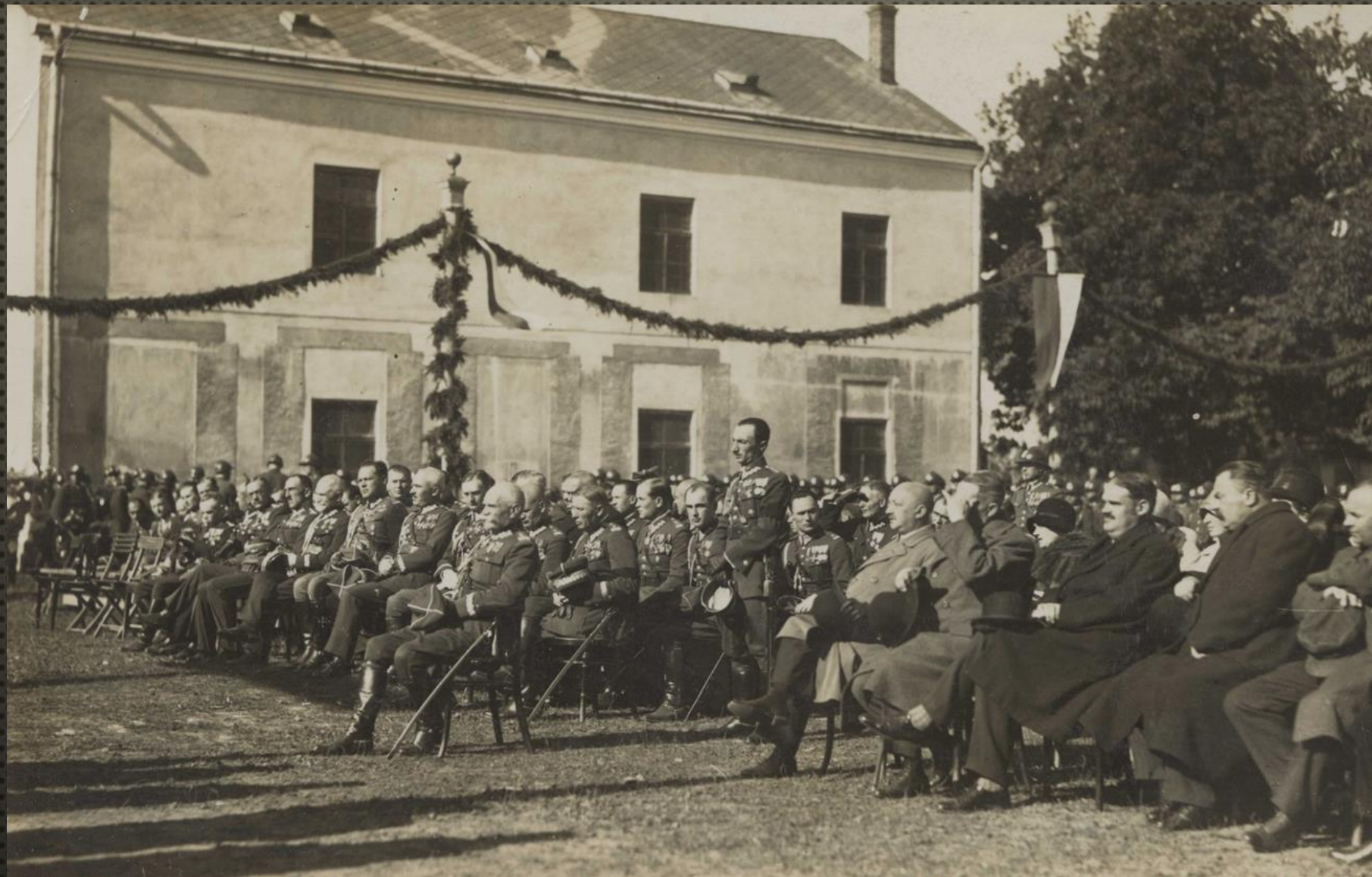
ŚWIĘTO PUŁKOWE 3 PUŁKU PIECHOTY LEGIONÓW W KOSZARACH PRZY UL. KRAKOWSKIEJ, Z UDZIAŁEM SZEŚCIU GENERAŁÓW Z RODOWODEM LEGIONOWYM, 1929