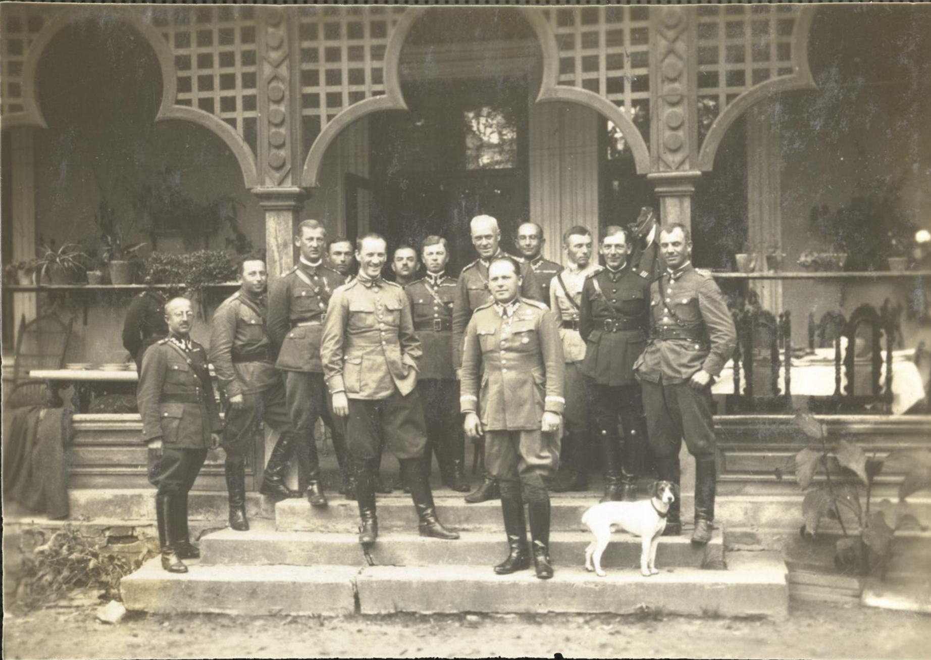
KORPUS OFICERSKI 24 DYWIZJI PIECHOTY Z GEN. WACŁAWEM WIECZORKIEWICZEM W ALTANIE NA ZAPLECZU KASYNA OFICERSKIEGO PRZY UL. GRUNWALDZKIEJ, LATA 20. XX W.