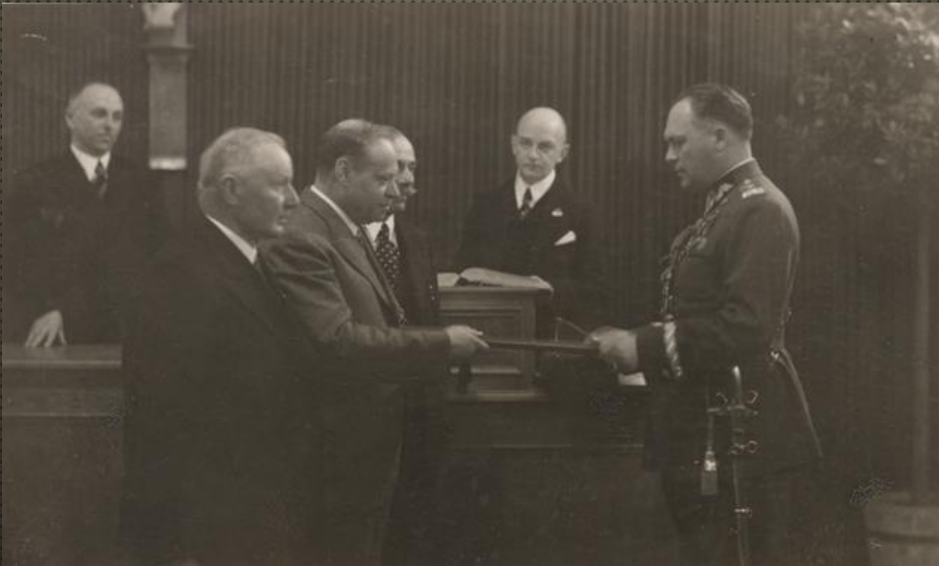
GEN. WACŁAW WIECZORKIEWICZ ODBIERA DYPLOM HONOROWEGO OBYWATELA JAROSŁAWIA Z RĄK RADNYCH, 1936