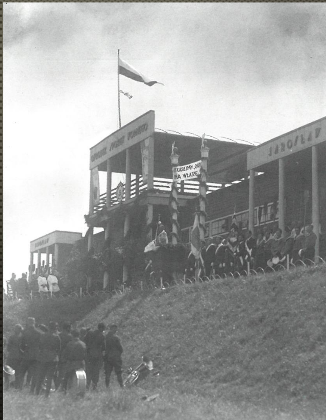
OŚRODEK SPORTU WODNEGO NAD SANEM W JAROSŁAWIU, 1935