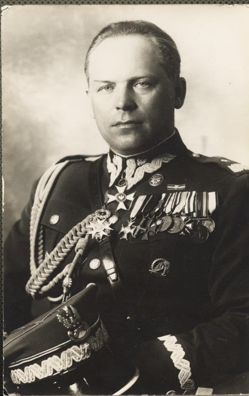
WACŁAW SCAEVOLA-WIECZORKIEWICZ (1890–1969), GEN. BRYG., DOWÓDCA 24 DYWIZJI PIECHOTY I GARNIZONU JAROSŁAW, LATA 30. XX W.