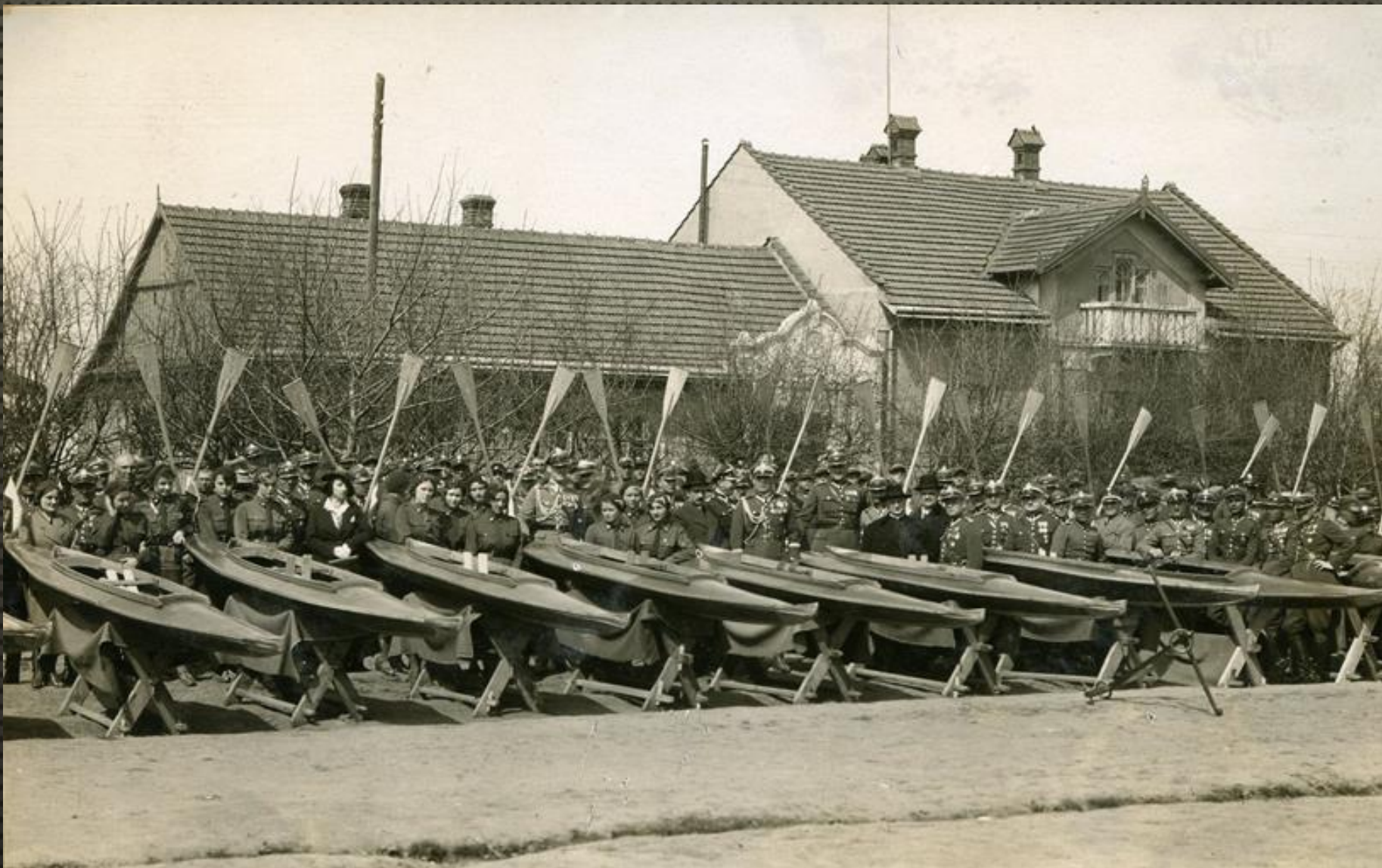
POŚWIĘCENIE KAJAKÓW W KOSZARACH PRZY UL. KOŚCIUSZKI, Z UDZIAŁEM GEN. WAŁAWA WIECZORKIEWICZA, 1931