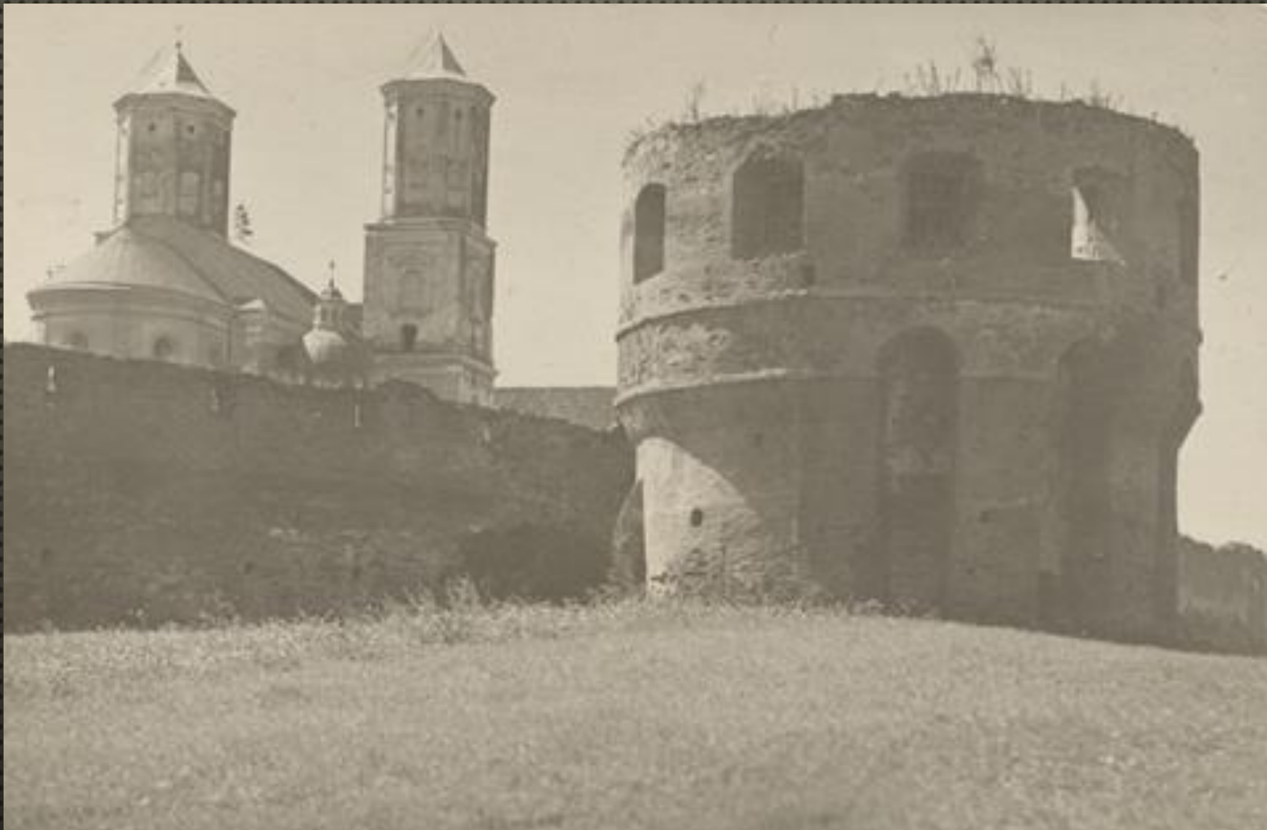
OPACTWO PANIEN BENEDYKTYNEK Z POCZĄTKU XVII w., BASZTA W PN.-WSCH. NAROŻU OBWAROWAŃ, OK. 1933