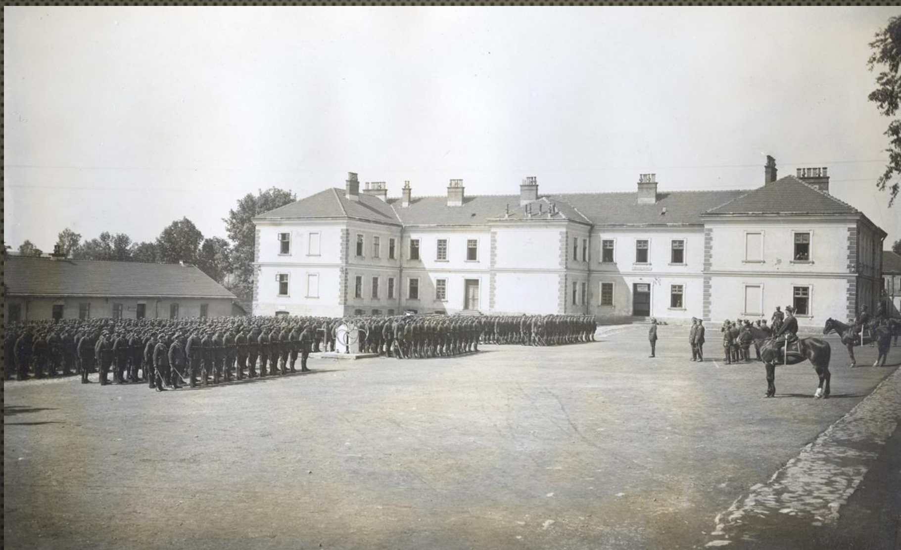
ŚWIĘTO PUŁKOWE 2 PUŁKU ŁĄCZNOŚCI W KOSZARACH PRZY UL. PRUCHNICKIEJ, OBECNIE PAŃSTWOWA AKADEMIA NAUK STOSOWANYCH (DAWNE PWSTE), 1928