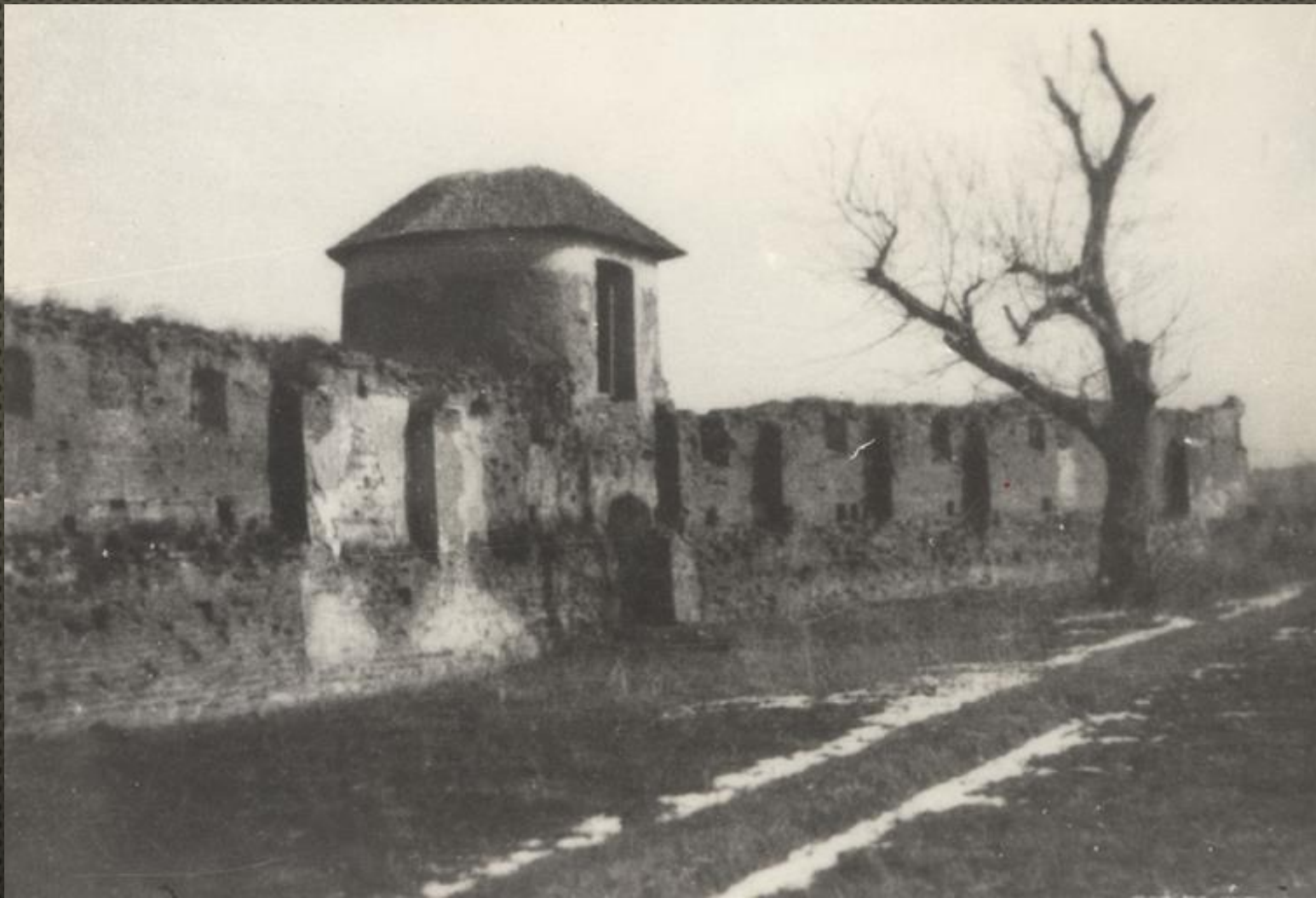
OPACTWO BENEDYKTYNEK Z POCZĄTKU XVII W. WIDOCZNY NA FOTOGRAFII FRAGMENT WSCHODNIEGO ODCINKA MURÓW, OK. 1935