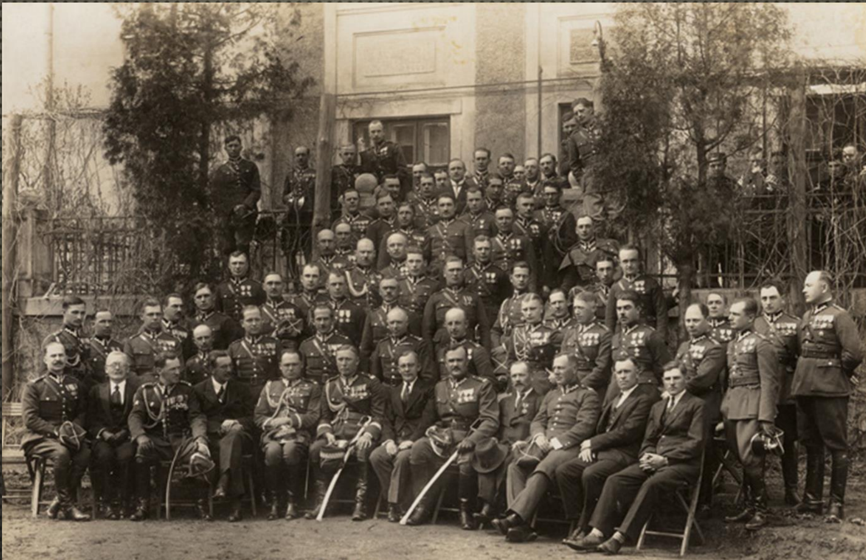
ŚWIĘTO PUŁKOWE 24 PUŁKU ARTYLERII LEKKIEJ W KOSZARACH PRZY UL. PONIATOWSKIEGO Z UDZIAŁEM GEN. WAĆŁAWA WIECZORKIEWICZA I GEN. ANDRZEJA GALICY, DOWÓDCY OKRĘGU KORPUSU NR X W PRZEMYŚLU, 1929