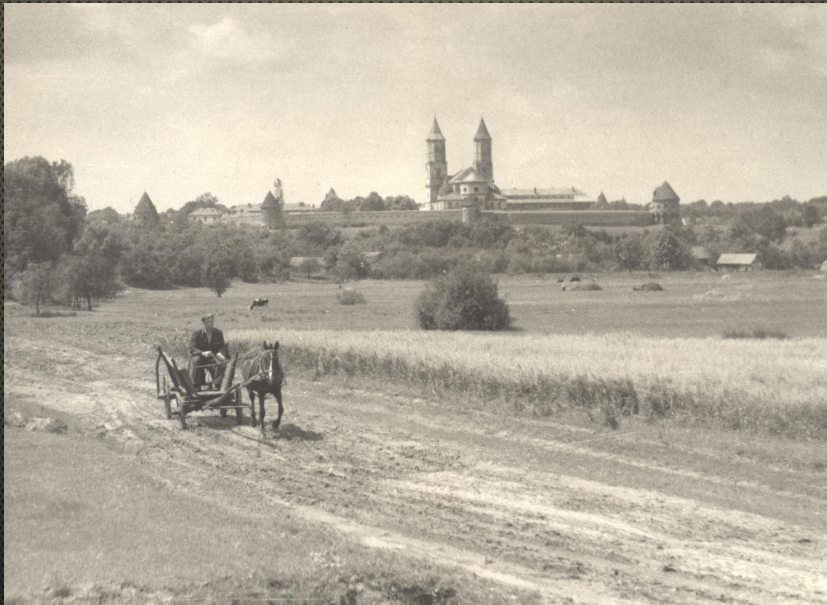
OPACTWO BENEDYKTYNEK Z POCZĄTKU XVII W., WIDOK OD WSCHODU, OK. 1956